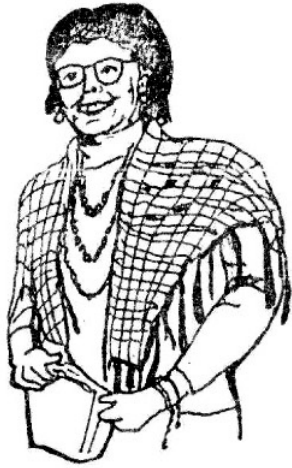
阿財嫂 (王博士之母)