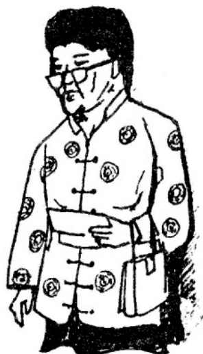
孔 部 長 夫 人